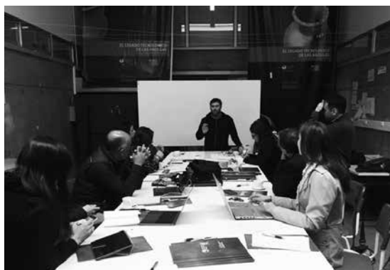
Sala de reuniones Departamento de Diseño UC Temuco.