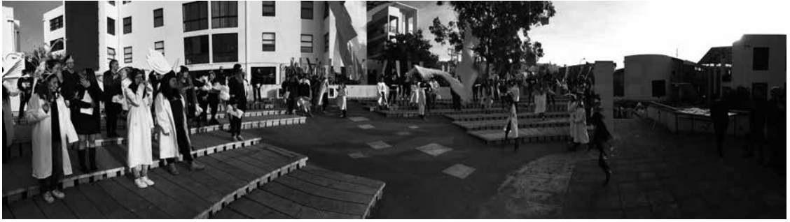
Aspecto general de la ceremonia