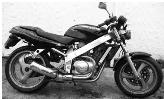
Moto Honda Bros 400. 1991 a la fecha.