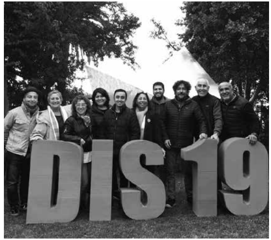
Profesores de la escuela de diseño, junto a la intervención que conmemoró la ceremonia.