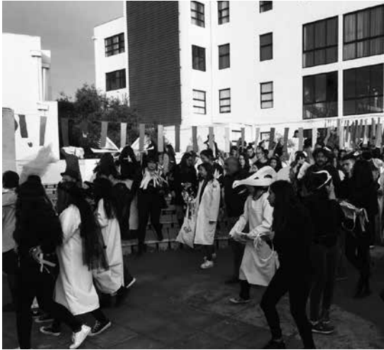
Cierre de la ceremonia para participar en la fiesta de camaradería