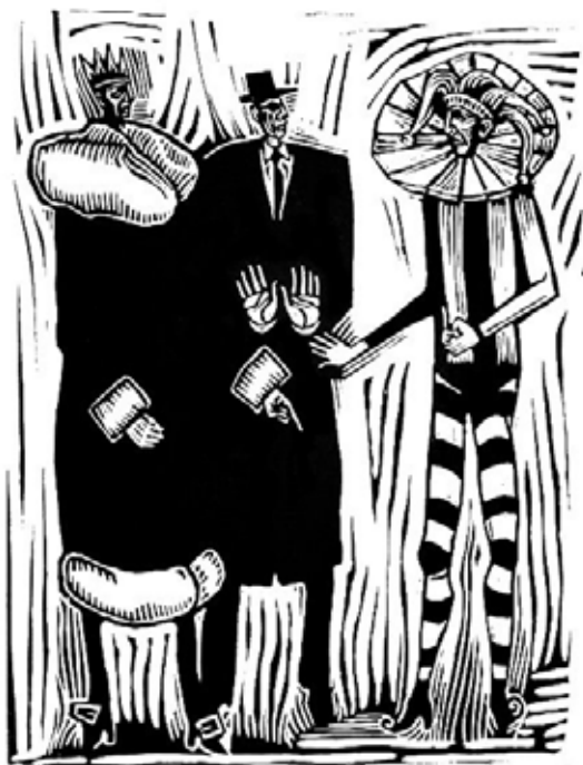
Sociedad actual. Linograbado, 60 x 28 cm. 2005

Que las imágenes generen o despierten emociones por sobre el contenido.