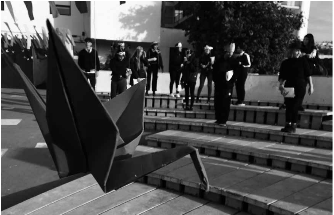
Alumnos de segundo año esperando el ingreso de los nuevos estudiantes.