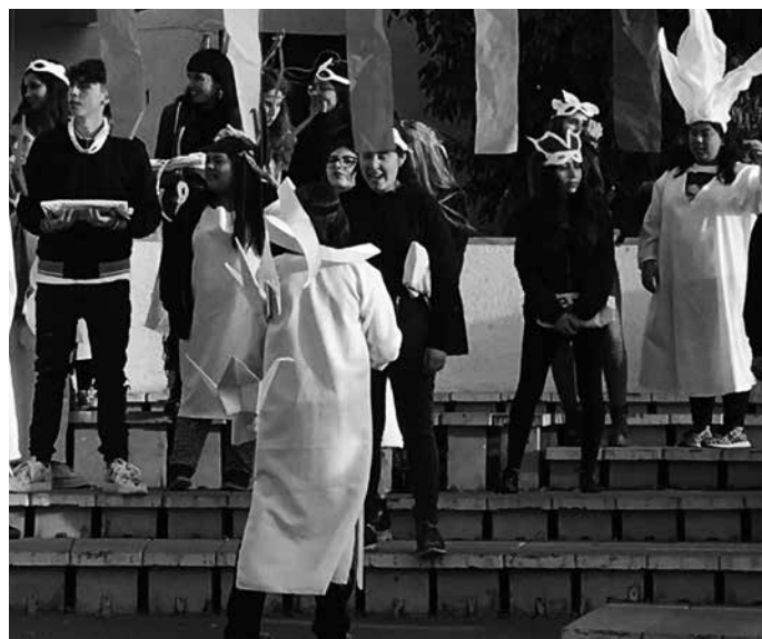
Desarrollo de la ceremonia. Los estudiantes de primer año se presentaron investidos de objetos creados y producidos por ellos mismos en que plasmaron el concepto del vuelo.