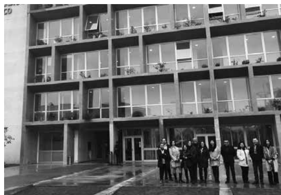
Recorrido del Campus San Juan Pablo II y Edificio Diseño / Facultad UC Temuco