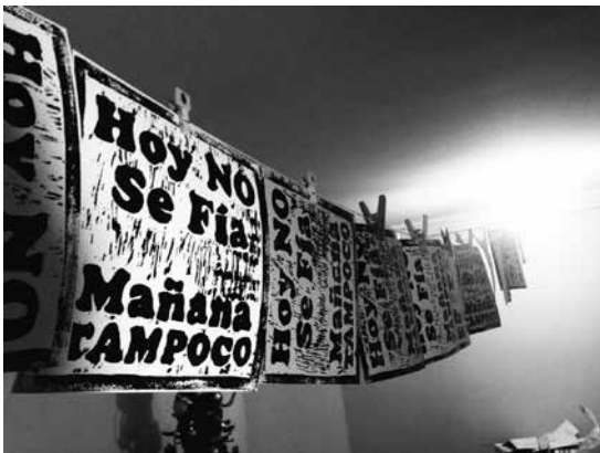
Impresión en Xilografía para la exposición independiente de Diseño Hoy no se fía, mañana tampoco .

¡¡¡Y tengo muchas cosas más por hacer...!!!