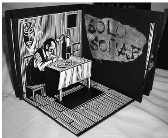
Vivir con miedo. Libro de artista. Indexado en la Biblioteca de la Universidad Politécnica de Valencia. Linograbado y técnica mixta. 20 x 20 cm. cerrado. 2009.

Con todo aquello que sea capaz de marcar una superficie 🖋️