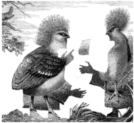
Creatividad. Grabado en offset manual. 25 x 15 cm, 2009 Los parlamentarios. Grabado en offset manual. 35 x 35 cm, 2010

nuestra sociedad, al mismo tiempo el impulso hacia el mundo emprendedor lo veo como uno de los catalizadores de un espacio laboral amplio y diverso. Por lo tanto mi visión sobre el Diseño y/o el escenario del mismo, es altamente positiva, la posibilidad de trabajo interdisciplinario asociado a los oficios en una diversidad altísima de ambientes posibles provee un vasto territorio a explorar para los diseñadores jóvenes, conscientes de una realidad de consumo hiper-atomizada donde el producto cultural adquiere un alto valor. La Industria Creativa puede ser una vía de desarrollo posible, en palabras de Norberto Chaves: El diseño aparece como un cuestionamiento no sólo de las ideologías que acompañaban las prácticas de la cultura, sino de las técnicas y de los procesos por los cuales la cultura era producida.